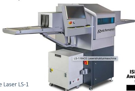
Machine Laser LS-1